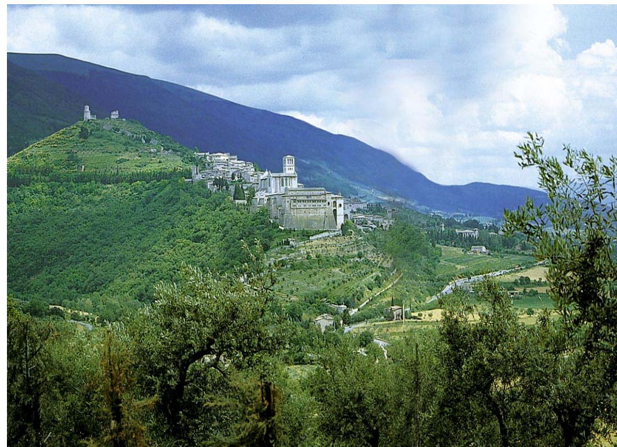
Un paesaggio che si ritrova come sfondo nei dipinti di Giotto...un paesaggio italiano.

Il luogo ha un significato altamente simbolico: proprio qui, con San Francesco, è nato il più alto modello di convivenza tra Uomo e Natura. Un messaggio di armonia che ha reso nel tempo Assisi un luogo universale dedicato alla pace e alla tolleranza.